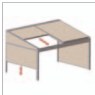
Lagune® + Sidefix = laterales móviles resistentes al viento