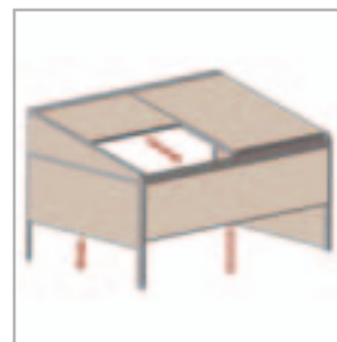
Lagune® + Frontfix + Sidefix = laterales y frente móviles resistentes al viento

(Para versiones pequeñas el cubierto consiste en sólo una parte de tejido)