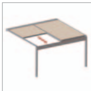
Lagune® = BASIS + Rooffix = Estructura + cubierto translucido resistente al agua y al viento

La pérgola de RENSON® es la única protección solar de tejidos resistente al viento integrada en la estructura, con una estructura básica que se puede cerrar por completo y dónde la cubierta de tejido es resistente al agua pero deja pasar la luz. Este producto innovador permite disfrutar de la terraza casi el año entero tanto para disfrutar de su jardín como para descansar en las terrazas de bares y restaurantes.