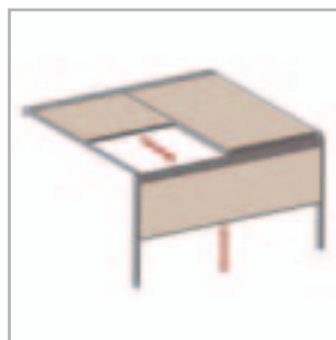
Lagune® + Frontfix = frente móvil resistentes al viento